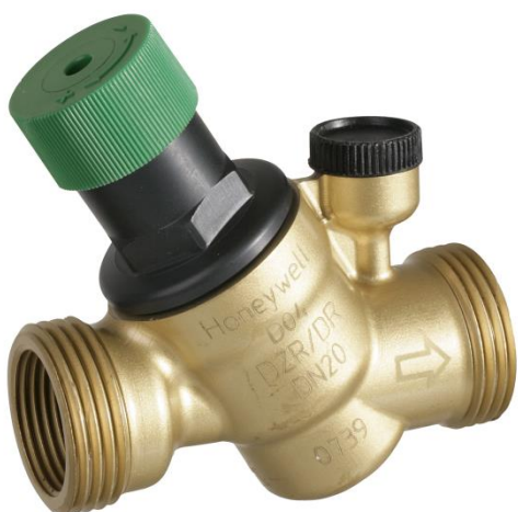
Honeywell D04FS – NRF nr. 5627257 (½" utførelse)