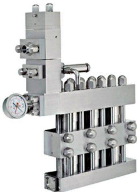
Rannie Xreiteiliger Zylinder mit Hydraulikantrieb