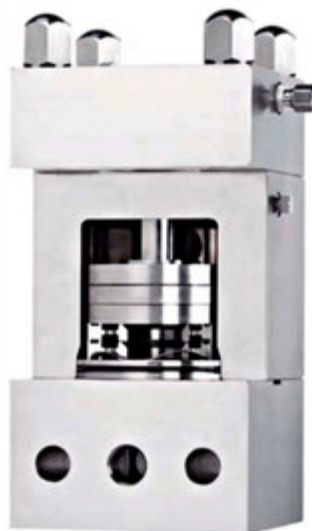
Patentierte Micro-Gap Ventil

Die Ergebnisse eines Einsatztests unter Realbedingungen zeigten, dass jährliche Einsparungen bis 15.000,- Euro möglich sind im Vergleich zu konventionellen Ventilen, die höhere Drücke benötigen.